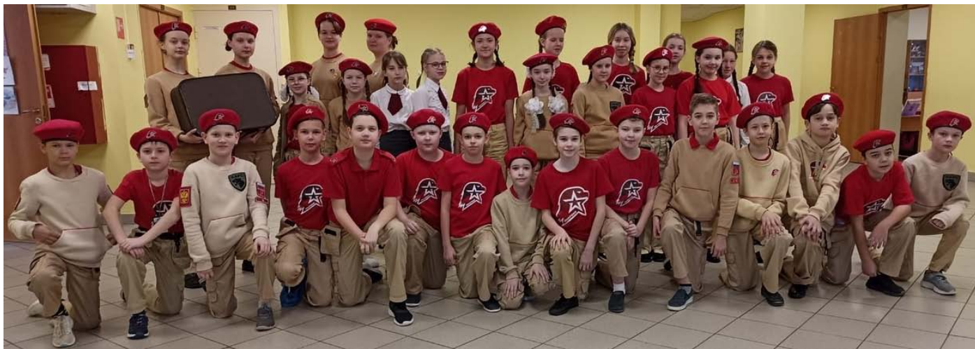
Юнармейцы 4В класса.