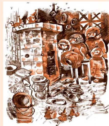
Иллюстрации из книги «Правдивая история Деда Мороза»